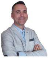
Carlos San José Candidato a la alcaldía en Elche